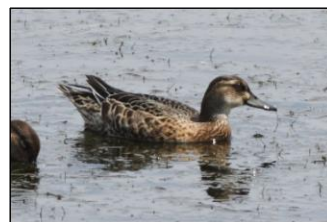
←シマアジ。 秋のシマアジはとても地味で、コガモとそっくりです。

その中で、8月30日にシマアジが16羽確認されたことが要注目です。シマアジは、水鳥公園では春と秋に数羽程度見られる数少ない鳥で、同時に10羽以上も見られるのはとても珍しいです。1998年4月6日に20羽確認されて以来、2番目に多い記録です。