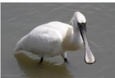
2015年4月23日 米子水鳥公園にて撮影。