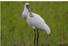
2015年6月6日 佐渡島で近藤健一郎氏撮影。 くちばし先端右寄りの半円形の黒点に注目。その他の細かな模様も一致しています。