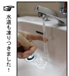
水道も凍りつきました！