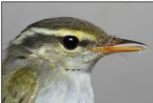
初記録のセンダイムシクイ (2016/9/9)