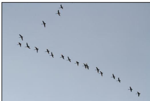
北東方向へ渡るコハクチョウ (2017/3/5撮影)