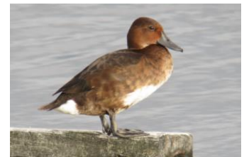
メジロガモのメス (2017年7月5日)