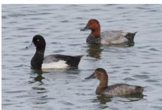
← 夏季に園内に留まる スズガモとホシハジロ (2017年7月1日撮影)