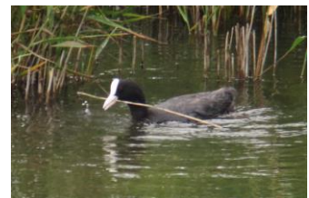
巣材を運ぶオオバン (2017年7月12日)

7月12日に、園内でオオバンが巣作りをしているのが確認されました。巣はヨシの茂みの中に作られており、ネイチャーセンターからはよく見えません。8月3日に確認したところ、卵が5個ありました。その後、チュウヒに襲われたこともありましたが、8月11日現在も抱卵中です。鳥取県ではこれまでにオオバンの繁殖が確認されたことはなく、これが初記録と思われれます。