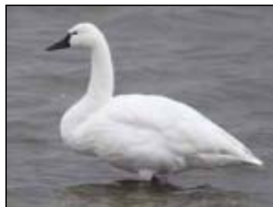
アメリカコハクチョウ(イメージ画像)