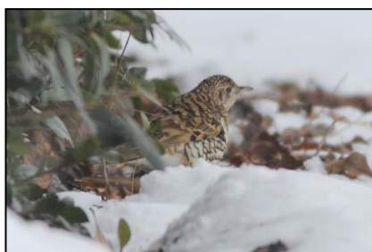
雪の中で食べ物を探すトラツグミ (2018年2月7日撮影)