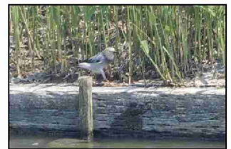
初記録のギンムクドリ

発見者のお父さんが撮影した写真を提供いただき、米子水鳥公園で確認された鳥の228種類目の記録となりました。