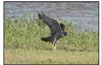
飛び立つ亜種オオハヤブサ?

ハヤブサの亜種であるオオハヤブサかもしれませんが、撮影距離が遠くて、よく分かりませんでした。